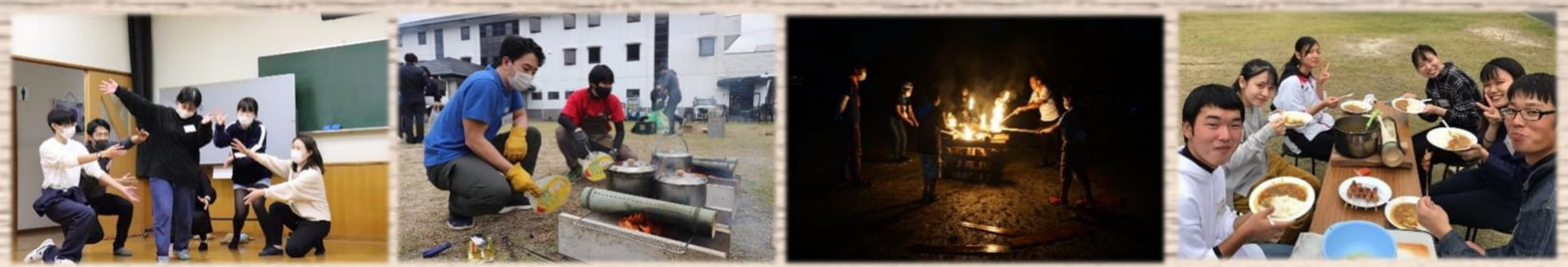
写真は令和3年に豊田市で行われたリーダー研修会の様子です