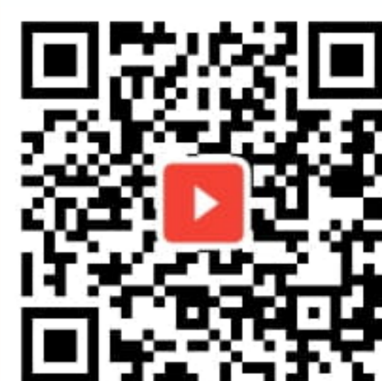
昨年の8月に行われたサマースクールの様子です