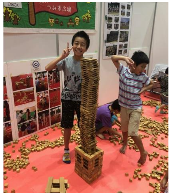
いつもたくさんのお子どもたちが集まります 上・右下:とやま環境フェア2019 左下:とうぶふれあいフェスタ2019