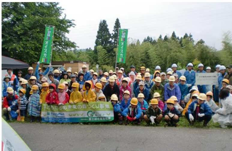
右上:親子で仲良く植樹 左中:皇太子即位記念植樹の舟橋町長と栃山区長 右中:皇太子即位記念植樹の久和会長と相田部長 左下:春の植樹後の記念撮影(右上)舟橋町長 子どもたちと植樹

助成:(公社)国土緑化推進機構 緑の募金 (「ファミリーマート夢の掛け橋募金」からの寄付)