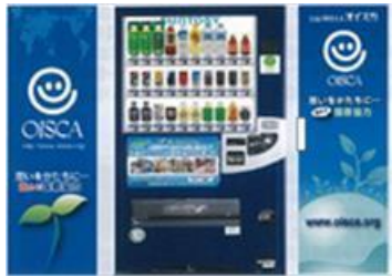
自販機デザイン例 (正面・側面)

詳しくは事務局までお問い合わせ下さい。(協力:コーシン・サントリービバレッジ(株))