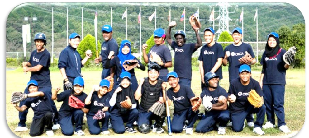
※FBS 福岡放送「頑張るキミに花束を！」にて、研修生たちが初体験のソフトボールに挑戦する姿を放映中です。