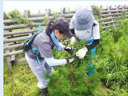
海岸林再生プロジェクト つる豆取り

オイスカ活動は会員の会費や寄付金で運営しています あなたも国際協力活動に参加できます ご入会をお待ちしています