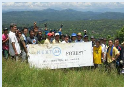
フィリピン植林ボランティア派遣