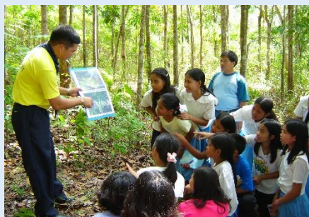
環境教育を行うオイスカスタッフ

すべての人々がさまざまな違いを乗り越えて共存し、 地球上のあらゆる生命の基盤を守り育てようとする世界を目指して 1961年に設立されました。本部を日本に置き、 現在36の国と地域に組織を持つ国際NGOです