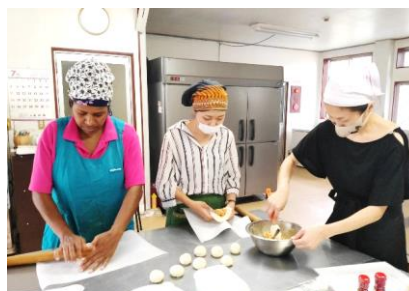
調理実習では肉まんの作り方を教えて頂きました。