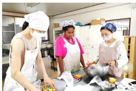
パン教室では豆マフィンの作り方を教えて頂きました。