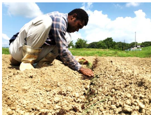
ネギの植付。一本ずつ丁寧に植え付けました。