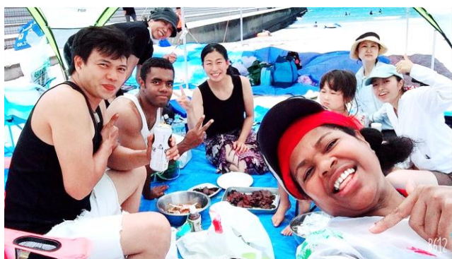
南知多の砂浜へ皆で遊びに行ってきました。