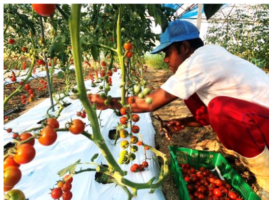
ミニトマトの収穫。今年は頑張って管理したので、収量が上がりました。